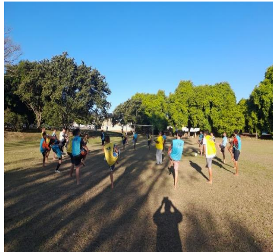
Fundamentos do Jogo Sub11 e Sub13- Futebol - Paulistano